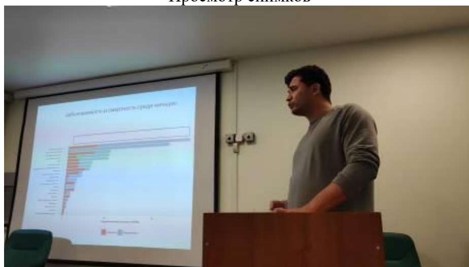
Конференция в Анадыре