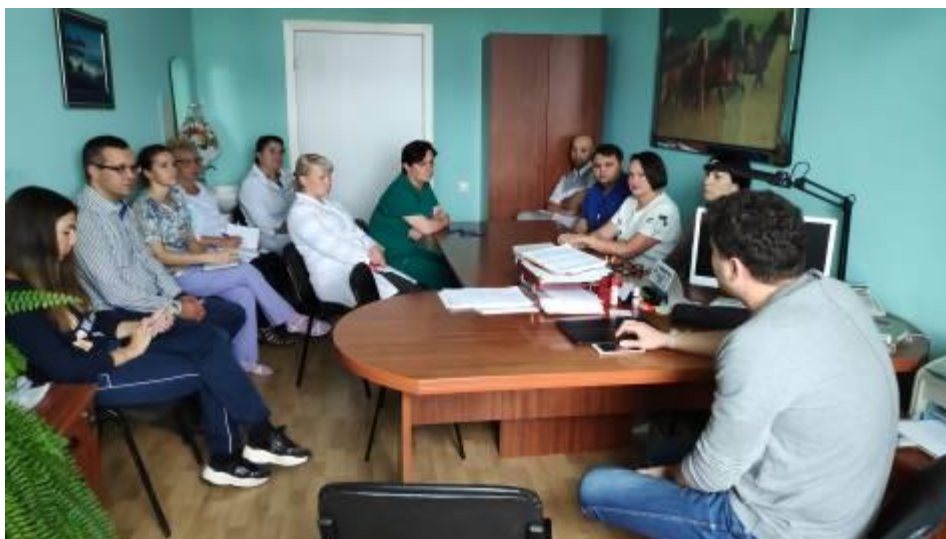
Конференция в Угольных Копях