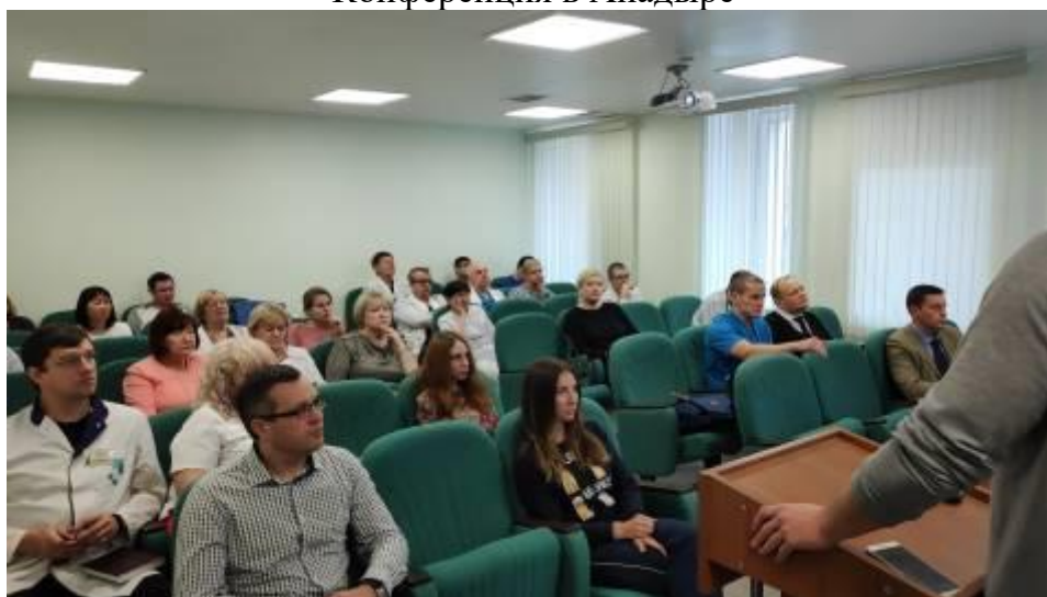
Конференция в Анадыре